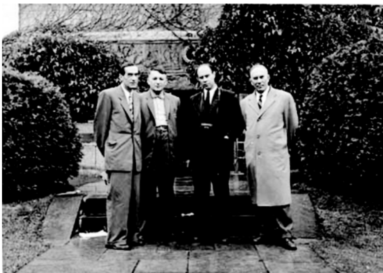
Рис. 35. А.Н. Леонтьев, А.В. Запорожец, Е.Н. Соколов на конгрессе в Канаде, 1954 г.

Foto – Zaporozhets junto a A. N. Leontiev e E. N. Sokolov 14º Congresso Internacional de Psicologia – Montreal, Canadá, 1954