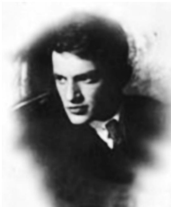
Foto – A. V. Zaporozhets com 22 anos