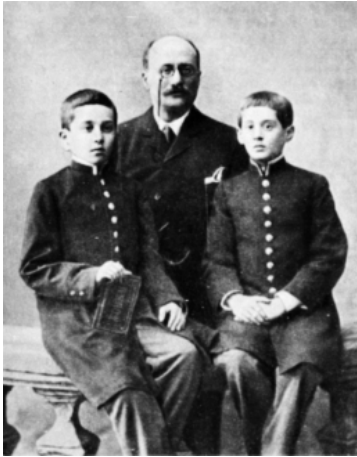
Foto – S.L. Rubinstein (esquerda) com seu pai e irmão em anos do ginásio