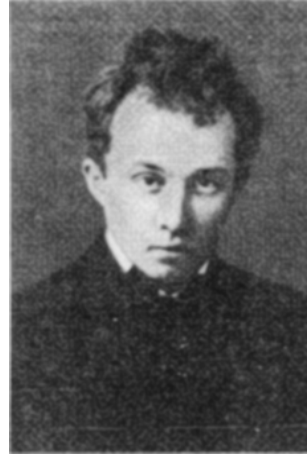
Foto – S. L. Rubinstein durante o período que estudava na Alemanha (1909-1913)

Fonte: http://psychologylib.ru/books/item/fo0/soo/z0000041/stoo2.shtml