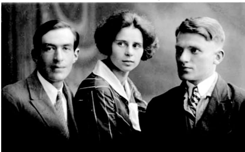
Рис. 18. А.Н. Леонтьев, Л.И. Божович, А.В. Запорожец. Начало 30-х гг.