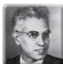
A. R. Luria