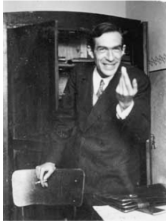
Рис. 19. А.Н. Леонтьев. Начало 30-х

Foto – A.N. Leontiev em Kharkov, com um gesto seu famoso, facilmente reconhecível.