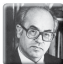
A. V. Petrovsky