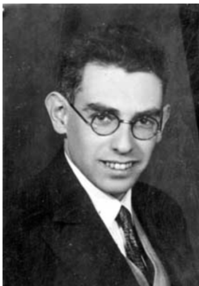
Рис. 16. А.Р. Лурья. Начало 30-х гг.

Foto – A. R. Luria, início dos anos de 1930.