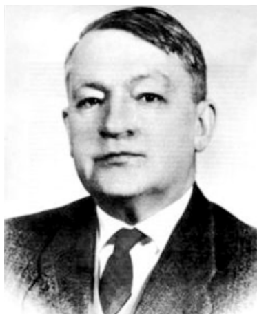
Foto – A. V. Zaporozhets na época em que lecionava na Faculdade de Psicologia da Universidade Estatal Lomonosov de Moscou.