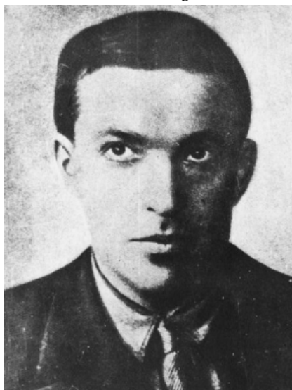
Foto – L. S. Vigotski