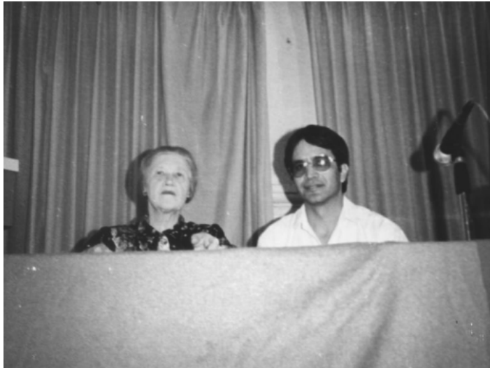
Foto – Ponencia en la Universidad Autónoma de Cuernavaca en 1992, México. Traductor del ruso al español: Luis Quintanar.

N. F. Talizina ha visitado México en 16 inolvidables ocasiones entre 1992 y 2006. En México participó con cursos y conferencias en diversas Universidades e Instituciones: Universidad Nacional Autónoma de México, Universidad Metropolitana, Universidad Autónoma de Morelos, Universidad Autónoma de San Luis Potosí, Universidad de Tijuana, Secretaría de Educación Pública de Querétaro e Hidalgo, y en 15 ocasiones inolvidables a la Universidad Autónoma de Puebla.