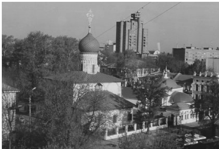
Fotos – Vistas de Ciudad de Yaroslavl.