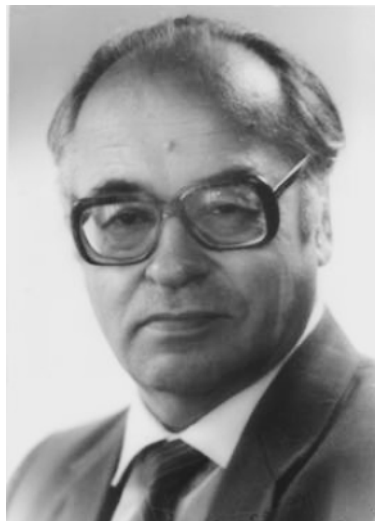
Foto – Arthur Vladimirovich Petrovsky