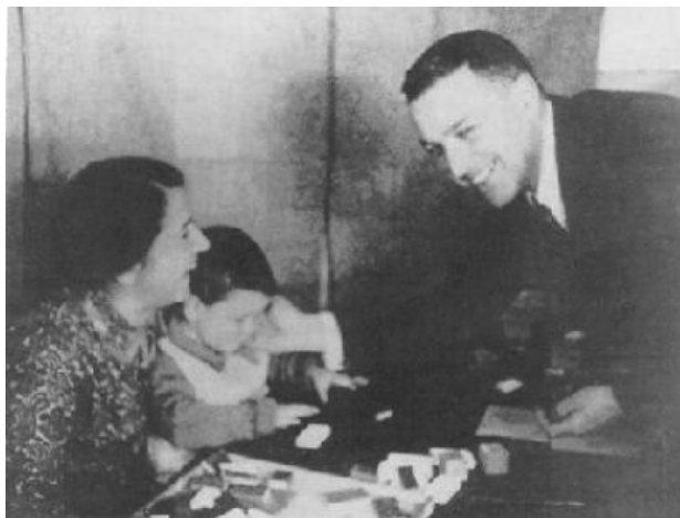
Foto – Vigotski durante um momento de descontração.

Fonte: http://atividademusical.blogspot.com.br/2011/09/lev-semionovich-vigotsk-fonte-de.html