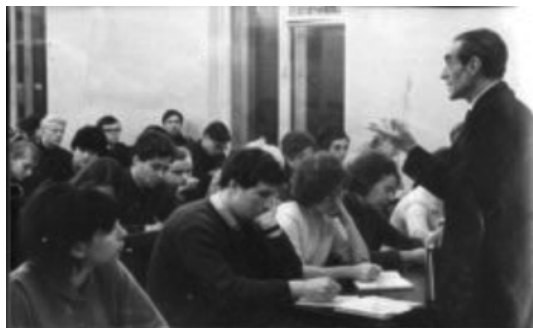
Foto – 24 de maio de 1969, A. N. Leontiev dá uma palestra na universidade.

A década de 1960 marcou o período em que a Ciência Psicológica se destacou no mundo acadêmico como Faculdade e não mais como Departamento, Seção ou Laboratórios vinculados às Faculdades de Filosofia já existentes desde o período czarista. Em 1963, A. N. Leontiev tornou-se chefe da Seção de Psicologia da Faculdade de Filosofia da Universidade de Moscou e, desde a criação da Faculdade de Psicologia até os últimos anos de sua vida, foi seu decano permanente.