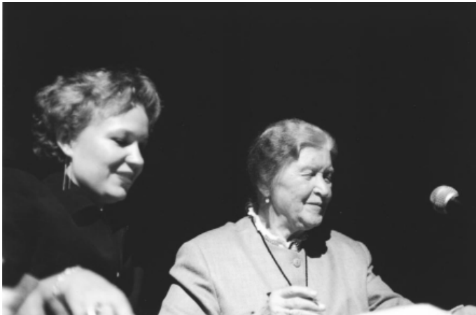
Foto – Ponencia en el Centro de Convenciones de la ciudad de Puebla en noviembre del 2002. Traductora del ruso al español: Yulia Solovieva