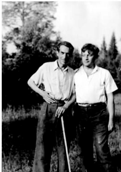
Рис. 28. А.Н. Леонтьев и А.В. Запорожец на отдыхе (Подмосковье, Аксаково, 1949)