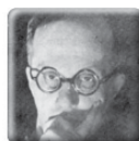
S. L. Rubinstein