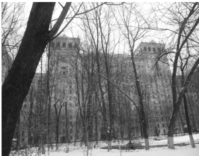
Foto – Edificio en el que vive Nina Talizina en la calle Universitetsky prospekt en la ciudad de Moscú.