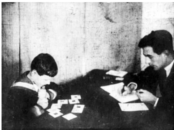
Рис. 17. А.Н. Леонтьев проводит эксперимент по памяти. Вторая половина 20-х гг.

Foto – Leontiev em seu estudo sobre a memória.