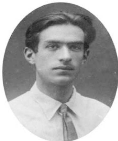
Рис. 13. А.Н.Леонтьев. 1924 г.