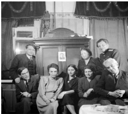
Рис. 27. Школа Л.С. Выготского, конец 40-х гг.

Foto – A.N. Leontiev e o grupo de estudos de Kharkov